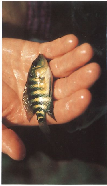
Soeben gefangenes Exemplar von „C.“ urophthalmus alborum