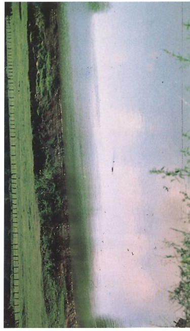
Die unscharfe Viehtränke mit dem unscharfen Krokodil in der unscharfen Bildmitte