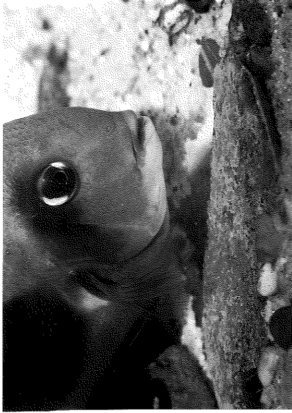
Uaru amphiacanthoides, Weibchen mit Gelege

Aus Anhang 8 läßt sich entnehmen, daß sowohl in Biotodoma warrini als auch in Dicrossus filamentosus aus Ufermähe größere Mengen Früchte und Samen gefunden worden sind und daß Satanoperca jurupari aus überschwemmten Waldgebieten sich ebenfalls so ernährt.