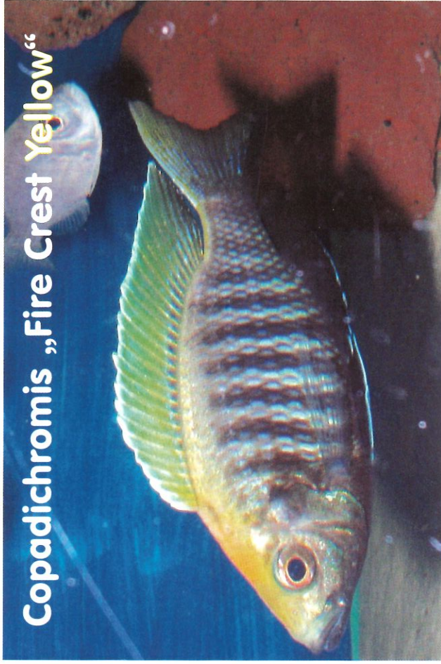
Copadichromis „Fire Crest Yellow“